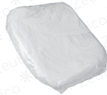
PAQUETE C/ 100 PZAS