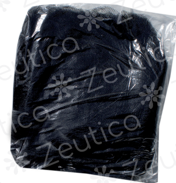
PAQUETE C/ 100 PZAS