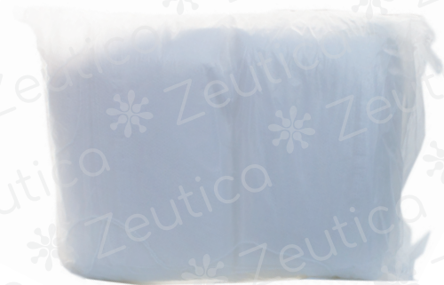
PAQUETE C/ 150 PZAS.