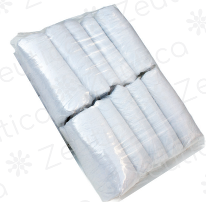
PAQUETE C/ 100 PZAS.