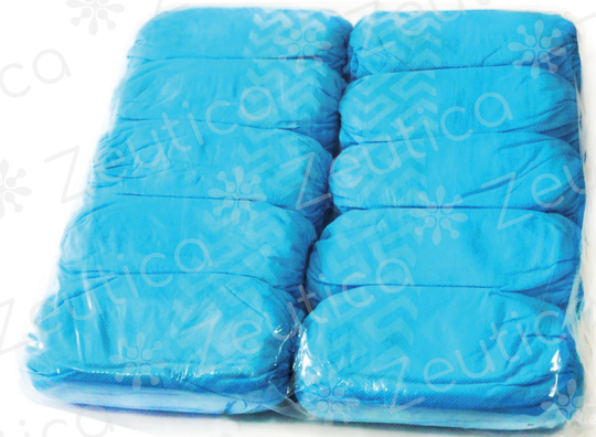
PAQUETE C/ 100 PZAS